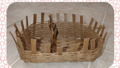
「細かご」が出来上がっていきます