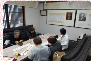
「細かご」の作成途中

本協議会では、これからの高齢者サロンとして「自律型高齢者サロン」に注目しており、特に旧東海道沿いにある「坊っちゃんサロン」を活用した取り組みを連続してご紹介しています。